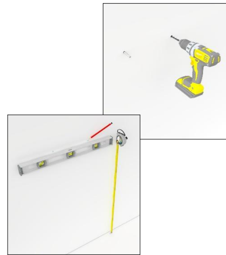
3. Aftekenen en boren van gaten in wand