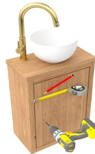
6. Greep aftekenen, boren en monteren (niet van toepassing bij Push to open front)