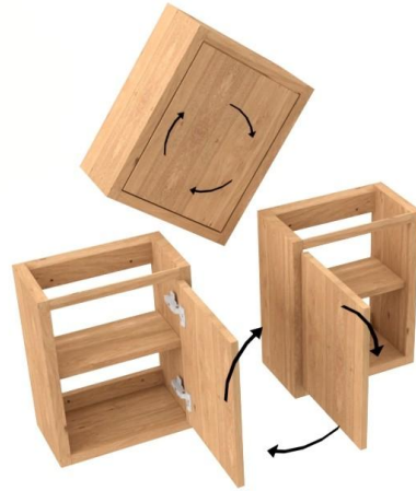
2. Kies gewenste draairichting deur door omdraaien van meubel