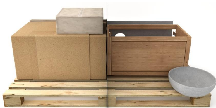
1. Levering uitpakken